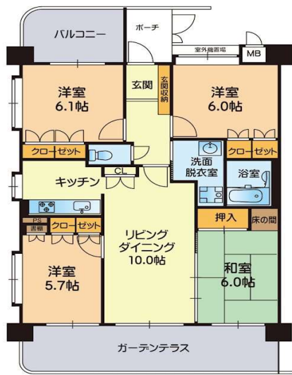
※略図により現況優先と致します。

交通 バス停 HI-1/H2-1：島崎保田窪線〔長嶺方面〕「県立大通り」 徒歩 3分 バス停 H3-1：帯山線「県立大通り」 徒歩 3分 豊肥本線 「東海学園前」駅 徒歩 39分