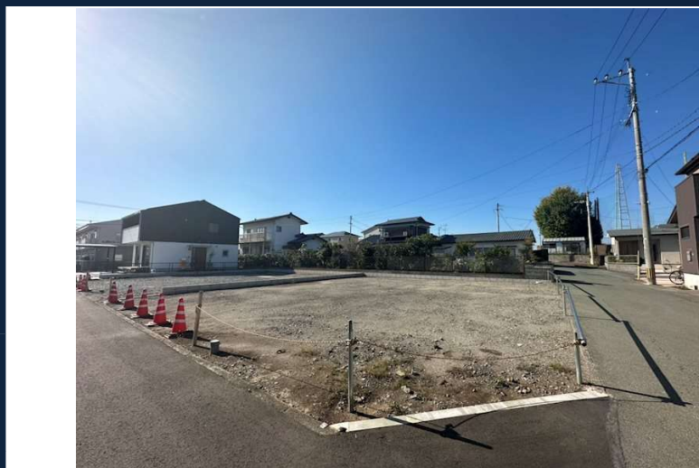
※現況優先となります。