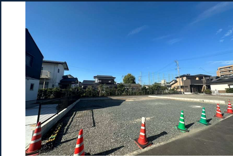
※現況優先となります。

本広告の有効期限は情報更新日より1か月間です。 情報更新日 2023年11月9日