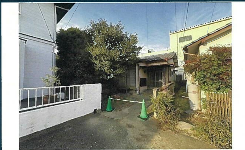
※現況優先となります。